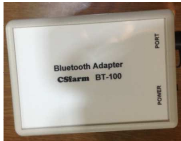
Blue Tooth コントロールモジュール BT-100