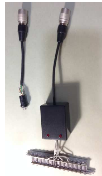
列車検出レール(右) 手動ボタン接点(左)