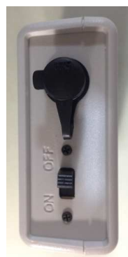
電源・コネクタ部

サイズ : (W) 90 / (D) 65 / (H) 28mm 電源 : 電池 CR123A (3V) 重量 : 98g (電池込)